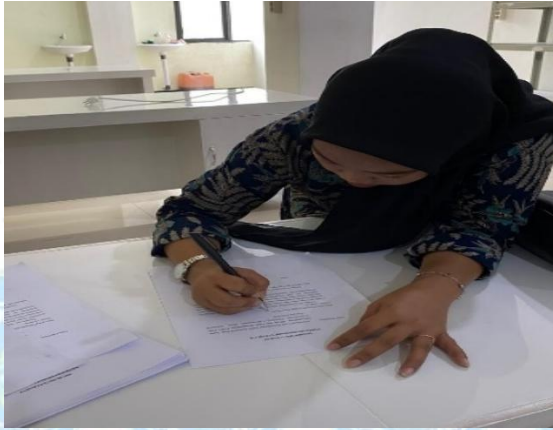
Pengisian kuesioner dan informend consent