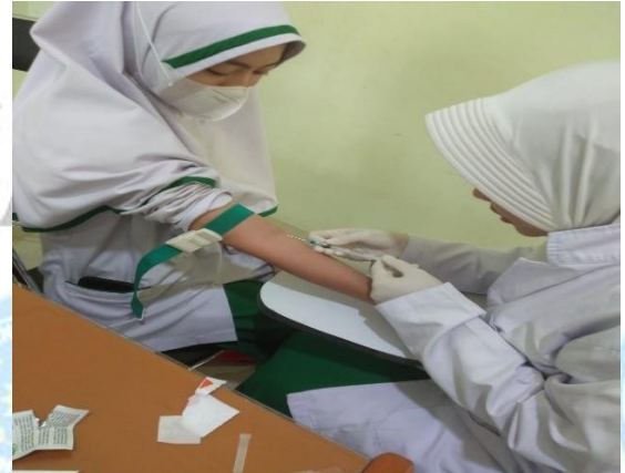
Pengambilan sampel darah vena durasi tidur kurang <7 jam