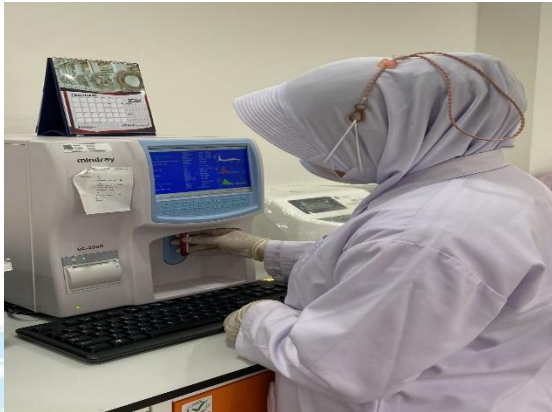
Pemeriksaan sampel menggunakan alat Hematology Analyzer Mindray BC-2800