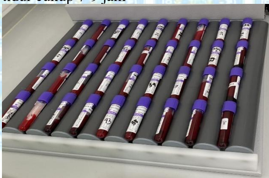
Sampel dihomogenkan dengan alat Blood Roller Mixer