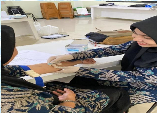
Pengambilan sampel darah vena durasi tidur cukup 7-9 jam