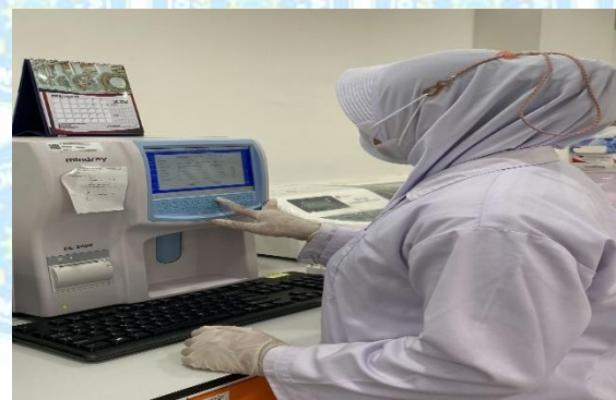
Memasukkan ID probandus ke alat Hematology Analyzer Mindray BC-2800