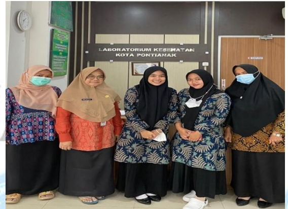
Foto bersama petugas laboratorium patologi klinik LABKES Kota Pontianak